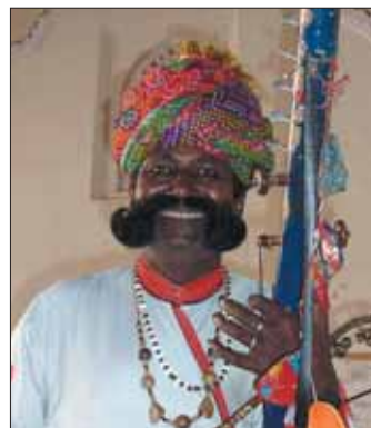
Die Inder sind ein sehr freundliches, höfliches und stolzes Volk.

Vor dem Besuch der Jama Masjid Moschee, des größten islamischen Gotteshauses Indiens mit einem Versammlungsvorplatz für über 25.000 Gläubige, muss man sich die Schuhe ausziehen, die Damen werden in Tücher gehüllt. Die Moschee befindet sich mitten im Basar, Bettler und Straßenhändler können da schon ein wenig lästig, aber nie zu aufdringlich oder gar gefährlich werden. Mit dem kleinen Bus sind