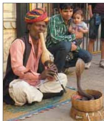
Schlangenbeschwörer verdienen sich an jeder Ecke ein wenig dazu.