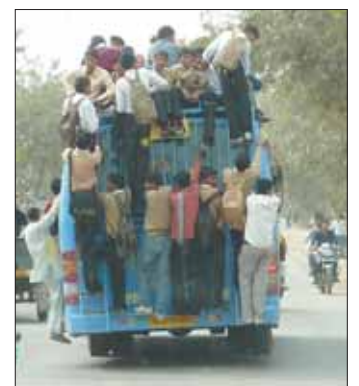
Schulbus auf indisch: Die Fahrgastkapazität ist deutlich erreicht.